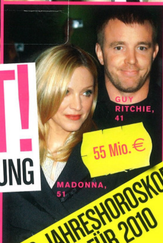
GUY RITCHIE, 41