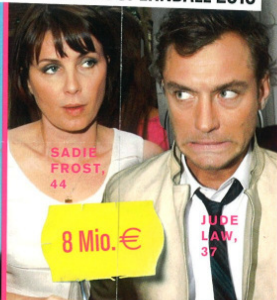
SADIE FROST, 44